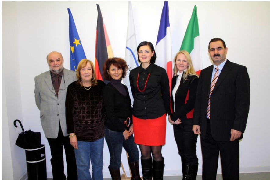
Das Foto zeigt die ordentlichen Mitglieder des Ausländerbeirates in der konstituierenden Sitzung.